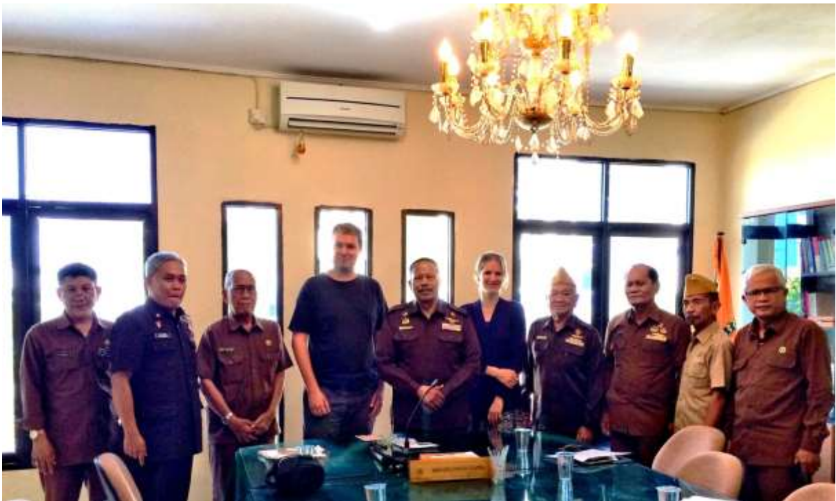
Bezoek aan het veteranen kantoor