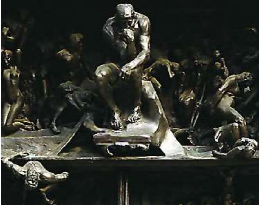
Rodin's Denker boven Dante's hel